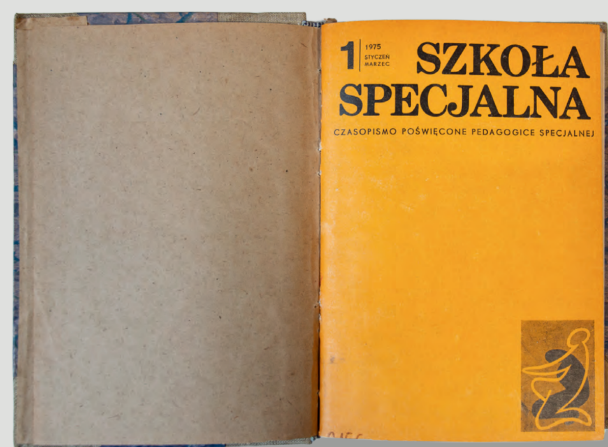
Pierwsza okładka kolorowa z 1975 r.

W 1957 r. Ministerstwo Oświaty wznowiło edycję czasopisma, traktując je jako swój organ – redakcja mieściła się wprawdzie w PIPS, ale wydawcą były Państwowe Zakłady Wydawnictw Szkolnych. Do głównego tytułu „Szkoła Specjalna” dodano podtytuł Kwartalnik poświęcony sprawom pedagogiki leczniczej. W 1959 r. podtytuł zmieniono na czasopismo poświęcone sprawom pedagogiki specjalnej, a od 1975 r. jest to czasopismo poświęcone pedagogice specjalnej. W latach 1957–1981 ukazywały się cztery numery rocznie, w latach 1982–1988 było to sześć wydań, a od 1982 r. – pięć numerów w roku. Od 1975 r. czasopismo ma jednolitą, kolorową okładkę i co roku jest to inny kolor.